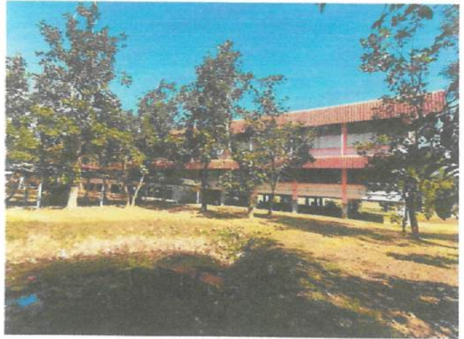
ภาพถ่ายด้านหลังอาคาร