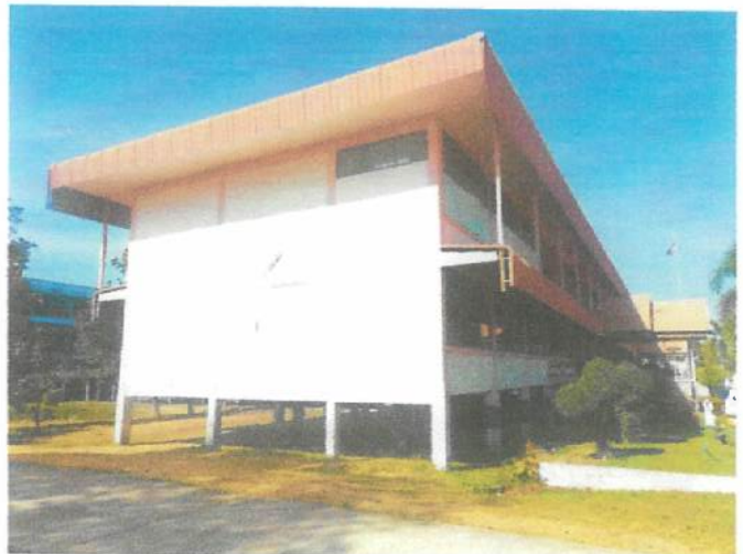
ภาพถ่ายด้านขวา