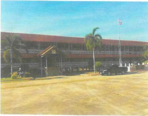
ภาพถ่ายด้านหน้าอาคาร