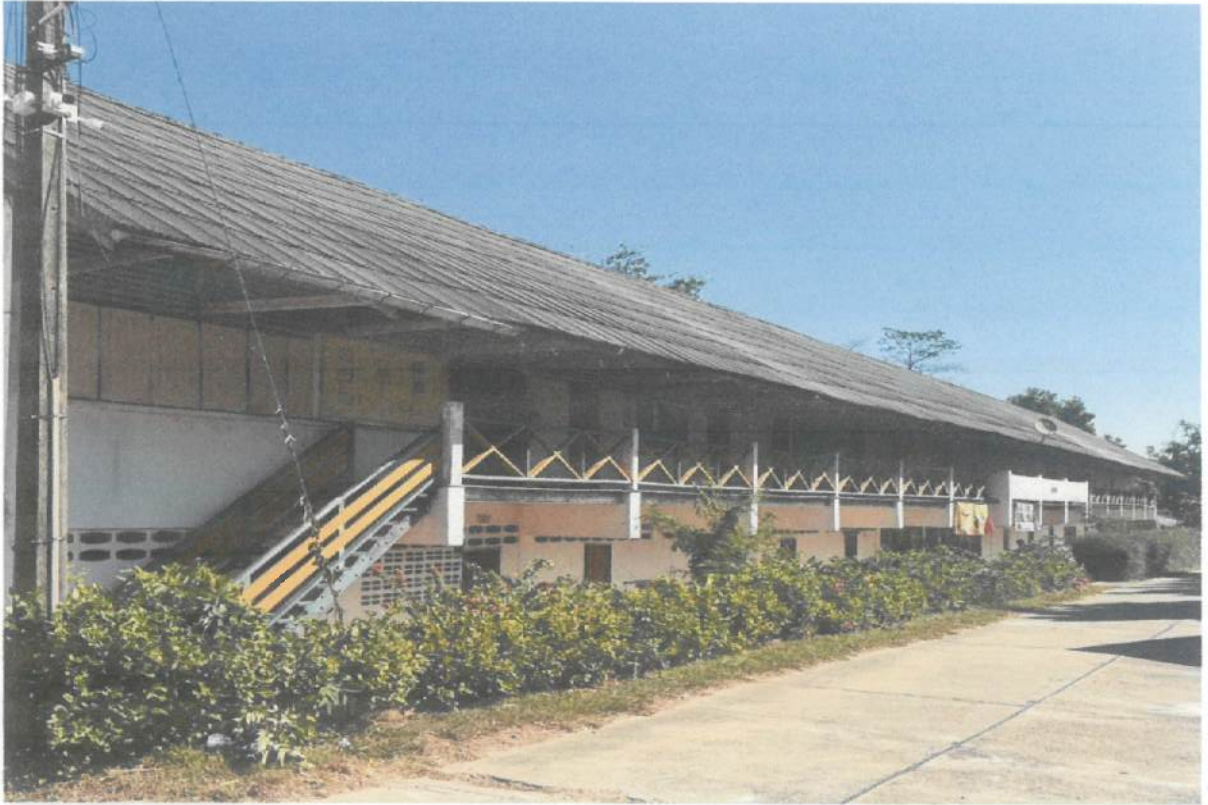
ด้านหลังอาคาร