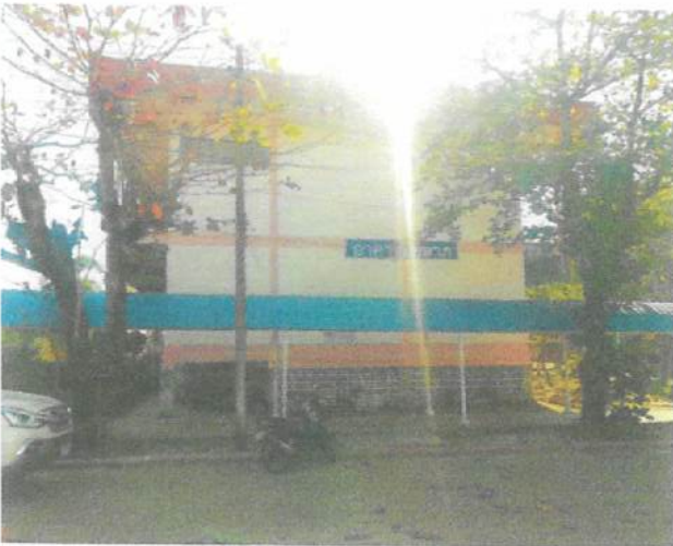
ภาพถ่ายด้านซ้าย